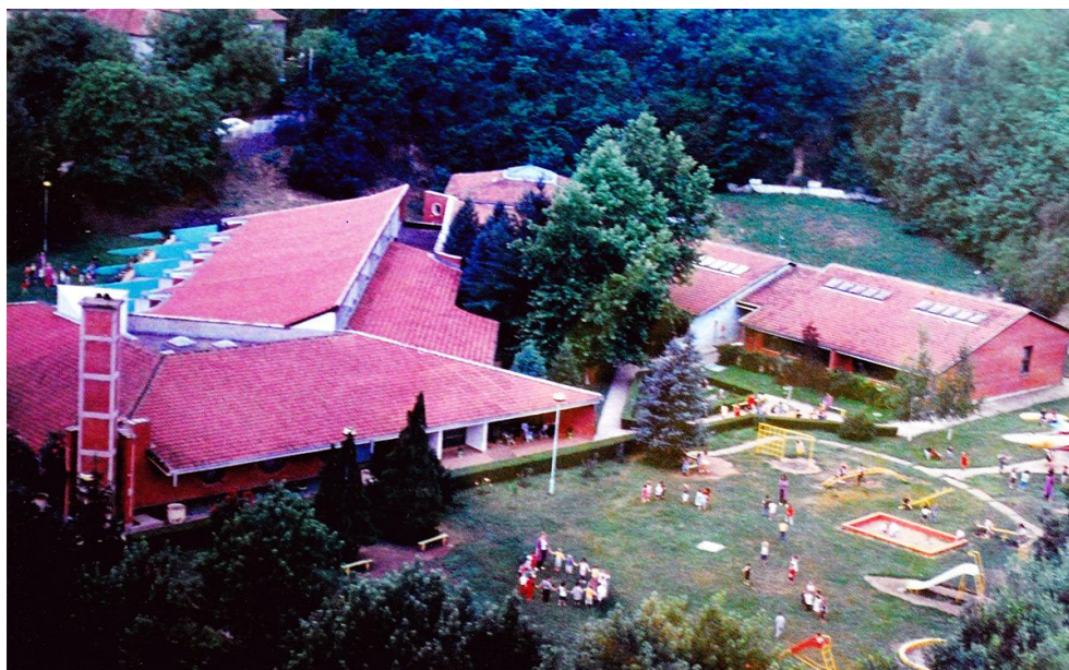
Слика 6: Објекат „Сунце“

Септембра, 1979. године у вртић су пошла деца узраста од 6 година у четири припремно-забавишне групе. У групама је било уписано 167 полазника, тако да би обухват деце од укупног броја шестогодишњака у општини процентуално износио 41,75%. Деца из целодновног боравака (јаслене групе и узраст од 3-7 година) први пут су дошла у „Сунце“ у понедељак, 24.12.1979. године. На јасленом узрасту у првој групи (од 1-2 године) било је уписано 9 полазника, док их је у другој (2-3 године) било 12. Узраст од 3-7 године, обухватиле су две групе: млађа са 15 и старија васпитно-образовна са 21 полазником. Поред наведених облика боравака, у јуну, 1980. године формиране су три нове групе деце која нису похађала полудневни боравак и оне су радиле пуне три недеље.