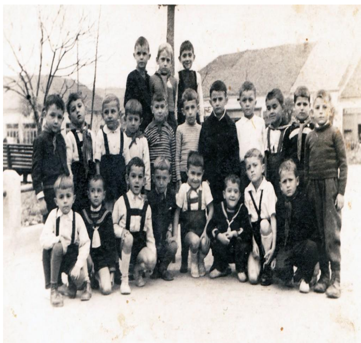
Слика 4 и 5: Прво забавиште на територији општине Куришумлија

Забавиште је отворено при државној основној школи у Куршумлији, а на иницијативу “Кола српских сестара”. Била је оформљена једна група са преко 30 деце. Забавиште је радило континуирано до 1940. године да би у току другог светског рата прекинуло са радом. Поново је отворено 1944 / 1945. године.