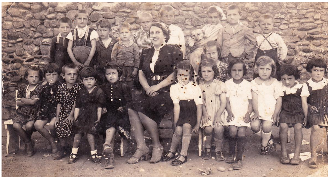
Слика 3: Први васпитач на територији општине Куришумлија

Забавиште је отворено при државној основној школи у Куршумлији, а на иницијативу “Кола српских сестара”. Била је оформљена једна група са преко 30 деце. Забавиште је радило континуирано до 1940. године да би у току другог светског рата прекинуло са радом. Поново је отворено 1944 / 1945. године.