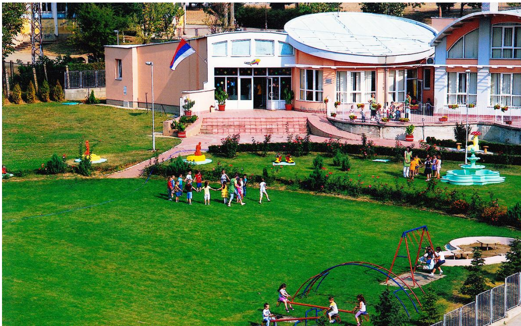
Слика 7: Објекат „Чаролија“

15. фебруара 2008. године у саставу Предшколске установе „Сунце“ у Куршумлији почиње са радом и објекат „Чаролија“. Површина објекта “Чаролија” износи 811 м 2 , а површина дворишног простора износи 4393 м 2 .